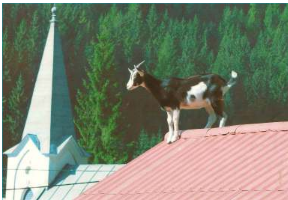
Aj takýto je výhľad v našej obci...

Je treba zdôrazniť, že i napriek uvedeným nepriaznivým okolnostiam, obyvatelia obce túžili vytvoriť si také kultúrne prostredie, ktoré už existovalo v mnohých iných obciach. Vznik ochotníckeho divadla bol hlavne pre mládež jednou z príležitostí kultúrneho vzostupu. Vďaka niektorým učiteľom, pôsobiacim na našej osemtriednej ľudovej škole, bolo možné touto formou úroveň kultúry v obci zvyšovať. Spomínam si na niektoré tituly divadelných hier, ako napríklad: „Zlatý kvet z tatranskej doliny, Marnotratný syn, Povinnosti a Jánošík“. Tieto divadelné hry nacvičovali, hlavne v zimnom období učitelia nielen s dospelými, ale i so žiakmi vyšších ročníkov školy. Všetci účinkujúci sa veľmi disciplinovane a s radosťou zúčastňovali cvičení po večeroch. Oblečenie / kostýmy / pre účinkujúcich poskytovala Matica Slovenská v Martine, väčšinou však boli vypožičiavané „kroje“ z Telgártu. Divadelné predstavenia sa konali vo vhodne upravených školských triedach a v „zale“ vedľa hostinca. Kulisy, zakúpené z finančných prostriedkov získaných od občanov, vytvárali vhodné divadelné prostredie. Obyvatelia obce radi a vo veľkom množstve navštevovali jednotlivé predstavenia. Že ochotnícke divadlo v Stratenej bolo na slušnej úrovni svedčí umiestenie na druhom mieste v súťaži asi piatich súborov ochotníckych divadiel z okolitých dedín a Dobšinej.